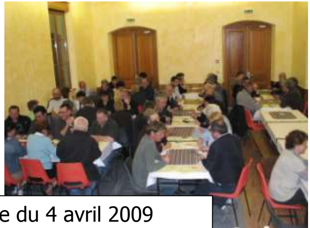
Concours de belote du 4 avril 2009