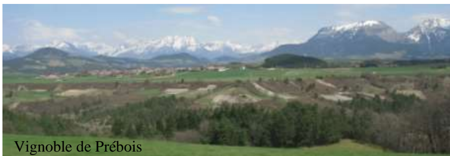
Vignoble de Prébois

vignesvigneronstrièves@orange.fr / 04 76 04 75 02