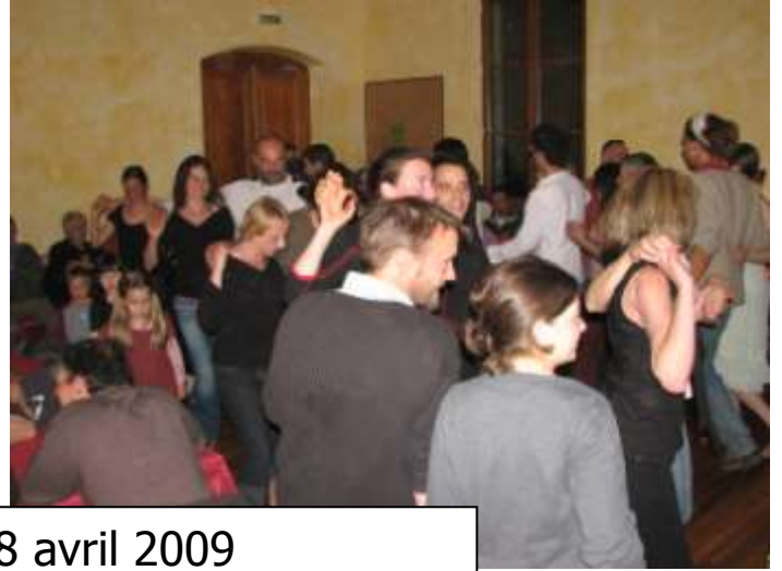
Bal folk du 18 avril 2009