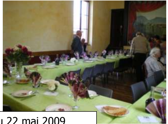
Repas des anciens du 22 mai 2009