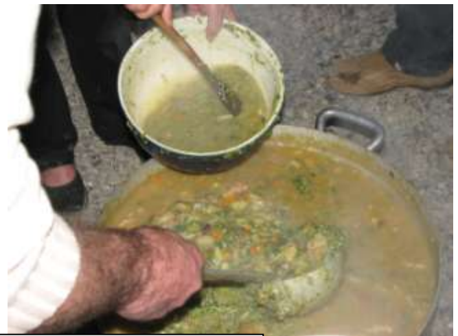
Soupe au pistou lors de la soirée théâtre avec la troupe « Trièves en scène »