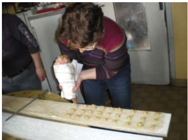
Confection de ravioli pour le repas du comité des fêtes